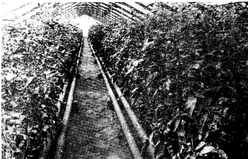
Tomaten in de kas (1931)

ming”. Het kapitaal bracht hij bijeen met een paar vrienden. Deze onderneming groeide uit tot de grootste kwekerij onder glas en had de druiventeelt als hoofdzaak, maar de tomatenteelt kreeg er ook een aanmerkelijke betekenis. In 1903 volgde een nieuwe zending naar Engeland van 3500 kg. In 1904, 1905 en 1906 vonden er geen verzendingen plaats. Dit waren de jaren dat Van den Berg weer werkzaam was in de cultures op Java. In 1907 werden door hem 40.000 kg tomaten naar Engeland verzonden. In de daarop volgende jaren teelde en exporteerde hij regelmatig tomaten.