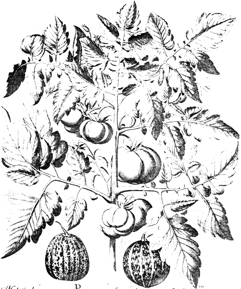
M. do Sacliarinus variegatus Poma amoris fructu luteo. Spudococynthis Pomiformis

schrijving van de tomaat en noemt haar "Pommes d'amour". Hij zegt ook dat de plant alleen wordt gevonden in tuinen van enkele plantenliefhebbers.