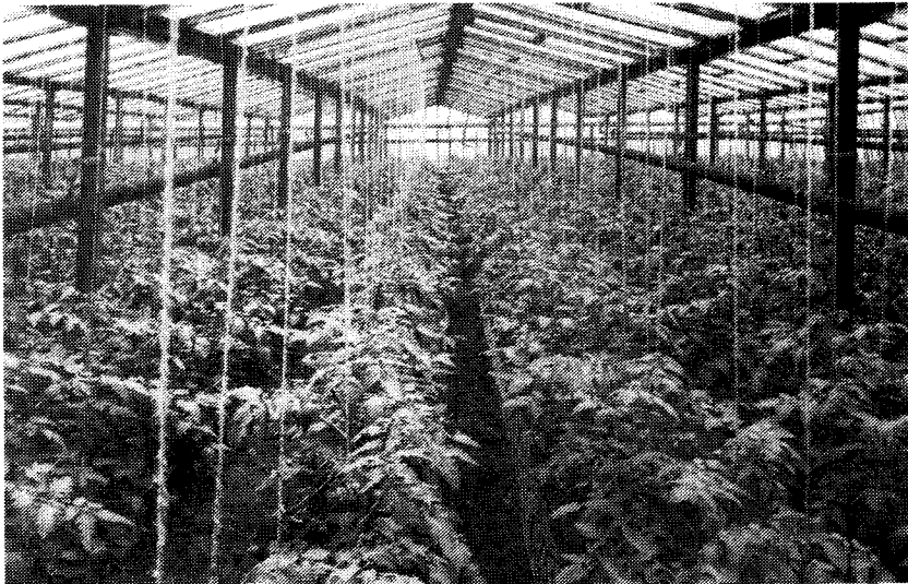
Stookwarenhuis met jonge tomaten (1939)

Tomaten worden tegenwoordig in grote kassen geteeld. Grote kassen werden en worden soms nog wel "warenhuizen" genoemd. Deze vorm van kassen is ontworpen door Jan Dirk van Vuurde uit Loosduinen. Het eerste warenhuis werd in 1903 op zijn bedrijf gebouwd, dat stond aan de Oud-Rozenburglaan te Loosduinen. Dit eerste warenhuis was nog vrij primitief ten opzichte van latere constructies en was geheel niet te vergelijken met de huidige moderne kassen. Toch zaten er in het eerste warenhuis al tuimelramen. Van Vuurde ontwierp deze