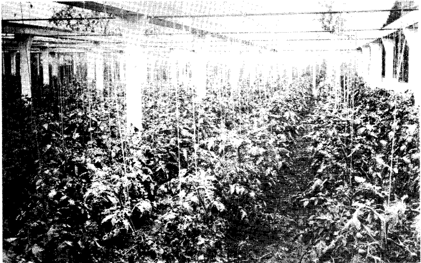
Tomaten in de open lucht; na enige tijd met glas gedekt (1931)

In het dagboek van de kwekerij Nieuw Honsel is te vinden dat het ras "Eclips" werd geteeld, enige jaren later "Fruhest Rote", "Sunrise" en "Sterling castle". In 1915 het bekende ras "Ailsa Craig". In de loop der jaren zouden nog vele rassen komen en gaan. Enkele spreken nu nog tot de verbeelding zoals: "Mikado, Potentaat, Eclips, Alice Roosevelt, Meteor, Moneymaker, Triumph, Money d'ore, Extase, Sonato, Calypso" en vele andere.