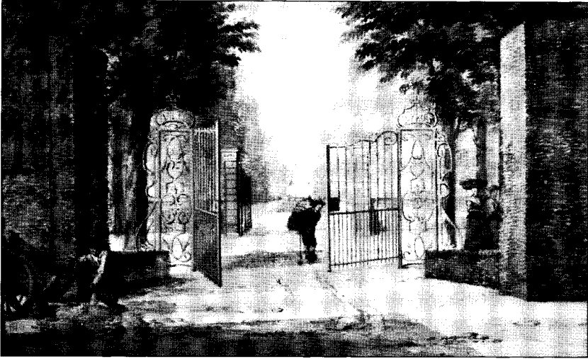
's-Gravensande 1749. Marskramer en boerinnen lopen over de Naaldwijkseweg langs de buitenplaats Zuydwind naar de markt. (Aquarel: A. Schouman).

ze vandaan komen of waar ze vroeger het langst verbleven. Daar moeten zij naar toe om in hun onderhoud te voorzien in plaats van in andere steden of dorpen te gaan bedelen. De hierop gestelde straf bedraagt volgens het plakkaat van 12 mei 1649 bij de eerste overtreding drie dagen op water en brood en bij herhaling geseling en verbanning.