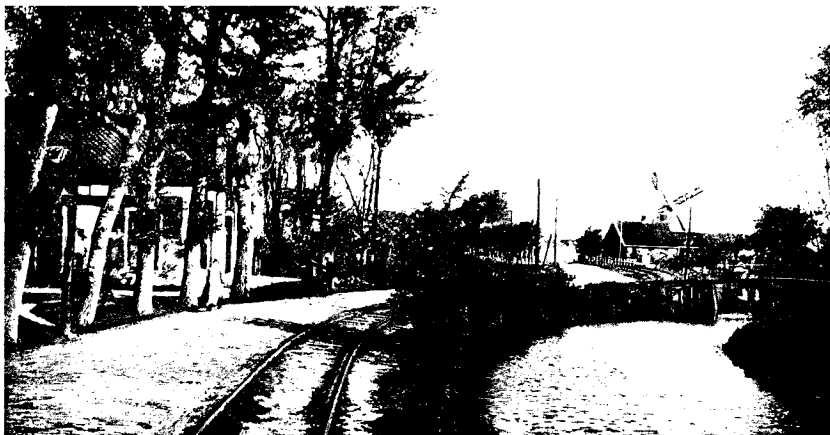
De Naaldwijkscheweg, nu Dijkweg, met links de dokterswoning en rechts de brug naar de Strijplaan.